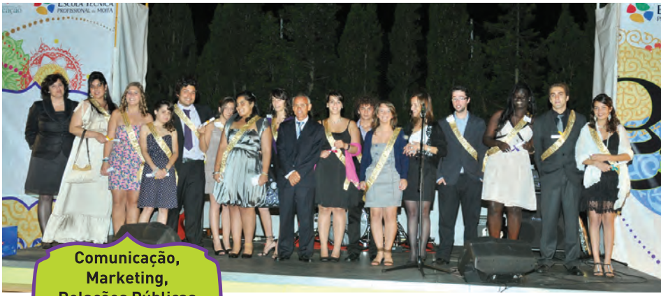
Comunicação, Marketing, Relações Públicas e Publicidade