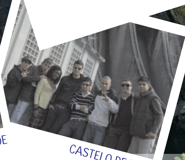
CASTELO DE BODE