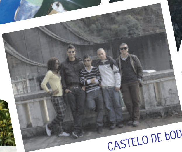
CASTELO DE BODE